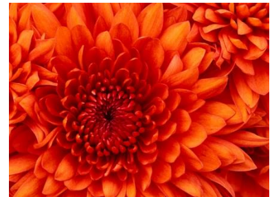
Slika 1. Širina slike je 5 cm. Veličinu i boju fonta odaberite sami.

Slika 1 (dodati kao referencu na sliku) je poravnata udesno u odnosu na tekst. Ovaj paragraph teksta ima uvučenu prvu liniju za 1.5cm, a razmak između linija teksta 1,3. Razmak prije i poslije paragrafa je po 12 pt. Paragraf je poravnat obostrano. Veličina fonta je 12.